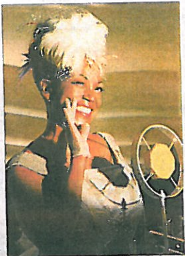
► La cantante Lucrecia.