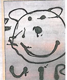
► Dibujo hecho con chocolate